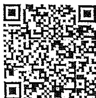
หลักสูตรเทคนิคการใช้ Microsoft Word ๓