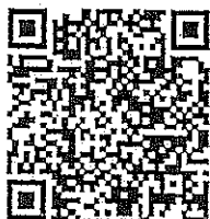
หลักสูตรการเป็นพิธีกรงาน แต่งงานอย่างมืออาชีพ