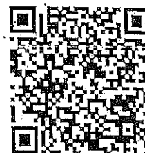
หลักสูตร การเขียนโครงการอย่างไร ให้ใช้งบประมาณ