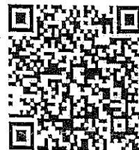
หลักสูตรเทคนิคและศิลปะการพูด ต่อหน้าชุมชน