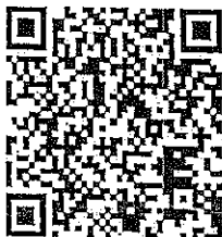
หลักสูตรเทคนิคการบริหาร ทีมงานอย่างมืออาชีพ