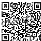
หลักสูตรวิทยากรกระบวนการ